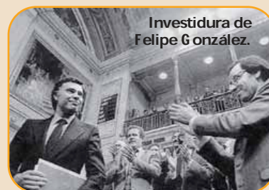
Investidura de Felipe González.

Por primera vez después de la dictadura franquista, un partido de izquierdas, el Partido Socialista Obrero Español, logra acceder al poder en España. Habían pasado únicamente siete años de la muerte del dictador cuando su peor pesadilla se había convertido en realidad. El día 28 de octubre, tal como habían pronosticado todos los sondeos, Felipe González , el que hasta hace muy pocos años había sido un perfecto desconocido se convertía en estrella rutilante que, con una personalidad controvertida, habría de dominar la política española durante los próximos 14 años.