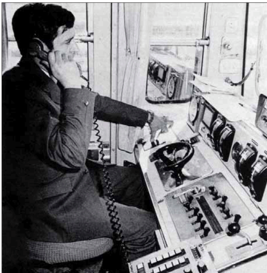
VIA LIBRE publicó, en tres entregas el Nuevo Reglamento de Circulación.

El segundo héroe del año no era español, ni siquiera habitante de la tierra. Un deforme extraterrestre que imploraba el regreso a su casa conmovió a todas las familias. "E.T. El extraterrestre" dio al cineasta Steven Spielberg uno de los mayores éxitos que ha conocido la historia cinematográfica.