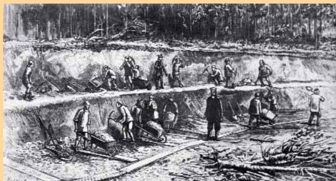
Obreros chinos tienden el Transiberiano.

mación tan diversa como "La magistral del carbón", donde se afirma que Polonia, país un poco denostado al lado de sus vecinos occidentales, supera el volumen por tráfico de mercancías franceses, alemanes y británicos. En otras entregas de esta serie se ha analizado el ferrocarril desde el punto de vista de la infraestructura, "Austria: trenes a 250 km/h"; la política, "Albania: se une a Europa"; la historia, "150 aniversario del tren alemán"; hasta desde el punto de vista de la viabilidad económica; "La anulación de las subvenciones".